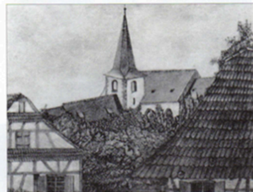
Document exceptionnel sur lequel figurent à la fois la nef de l'église du XVI e siècle et de celle construite au milieu du XIX e siècle.

Pendant tout le XVII e siècle et le début du XVIII e siècles des événements dramatiques s'abattent sur la population : en 1608 en effet, tout le village est inondé par le Rhin. A peine un an plus tard, 59 habitants succombent à une épidémie de peste. Au cours de la guerre de Trente Ans qui oppose catholiques et protestants, le village est pillé, brûlé et l'armée impériale qui occupe la région impose des corvées de ravitaillement et des privations de tout genre à la population. En 1648, le traité de Westphalie qui met fin aux affrontements, attribue l'Alsace à la France. En 1661 et 1662, de nouvelles inondations anéantissent une fois de plus les récoltes. Pour contrer le fléau des eaux, on entreprend alors des travaux d'amélioration des digues du Rhin entre Drusenheim et Offendorf. Le village subit encore des pertes