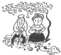
"Au Fil des Ans"